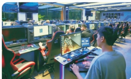
▲ 電競與遊戲產業菁英培訓基地