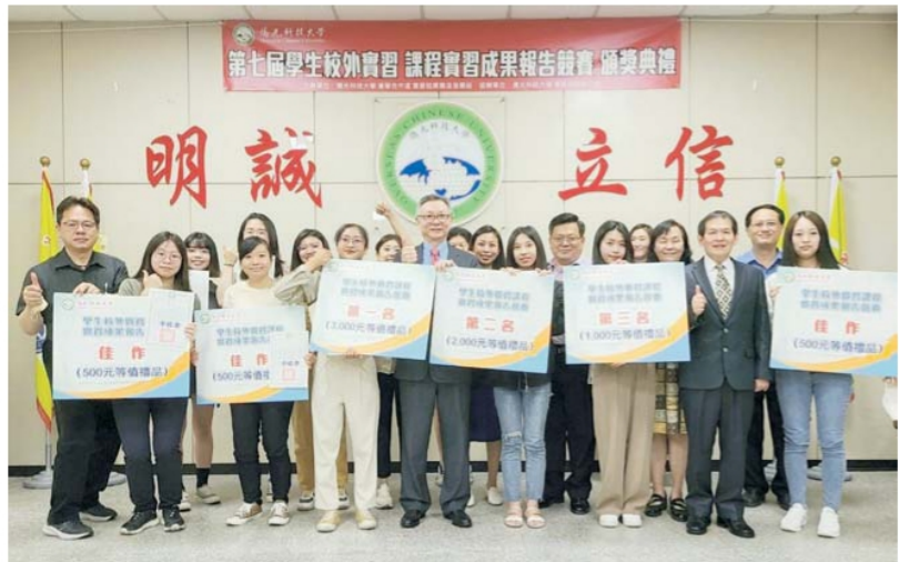
獲獎同學、指導老師與余致力校長合影

此外，校長也不忘提醒，未來同學畢業後，可能不會有太多參與競賽的機會，但千萬別忘記當初實習所養成的良好習慣，向別人學習時，也不要忽略應向自己學習。至於如何向自己學習？校長進一步說明，未來自己走過的人生中，無論是工作職場或家庭，凡發現自己有好的表現時，請停下來想一下原因，思考如何複製與精進；當然表現不理想時，也不要氣餒，一樣要反思並改進，才能不斷成長。