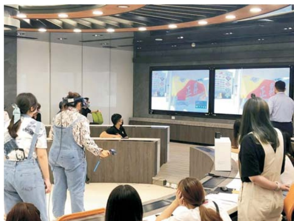
學生展示廠商導入元宇宙虛擬實境商店成果