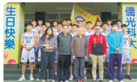
▲ 男子籃球隊榮獲大專籃球聯賽二級亞軍