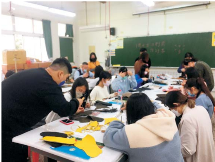
高中職生寒假製鞋體驗

另外，於此聯展中，亦有學生同樣也以鞋子結合品牌企劃相關課程，進行整體視覺設計企劃，可說除了彰顯台灣豐富的文化底蘊，更進而展現台灣新生代文化創意設計的能量。