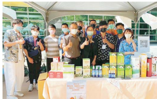
B組：茉莉花的故鄉-鉸麒企業有限公司 （彰化縣花壇鄉）