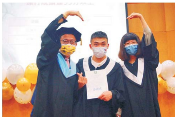
應英系107級畢業生與導師合影