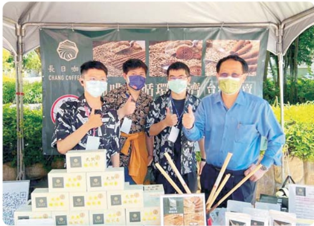
C組：國村咖啡莊園長日咖啡 (彰化縣彰化市)