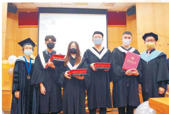
107級各項獎項獲獎畢業生與兩位導師合影