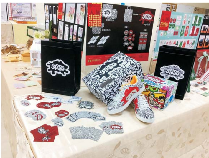
品牌企劃相關課程作品