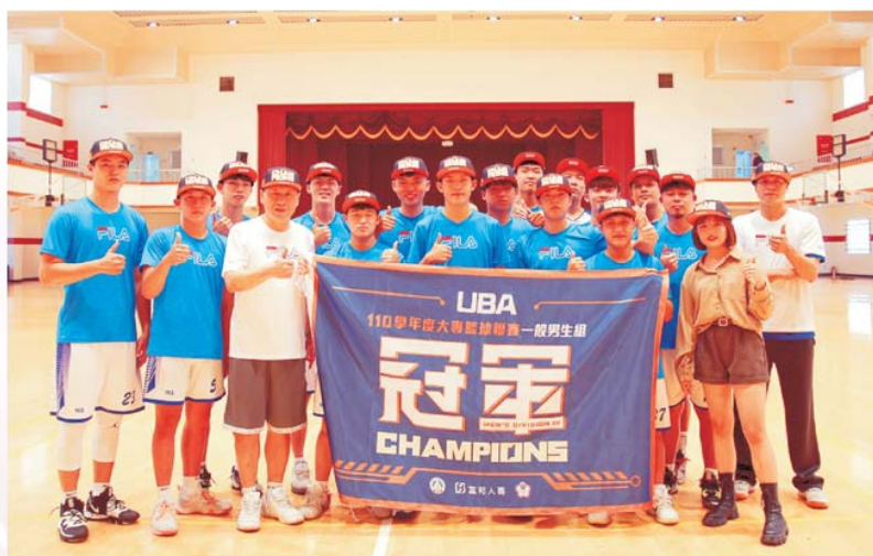
110學年度大專籃球聯賽一般男生組全國冠軍

本校向來重視學生體育、運動技能的培養，不僅招收一般高中職學生，也招收體育運動技優學生，本校擁有優質運動場館，提供訓練及比賽之用，對於運動的推展不遺餘力，此次各項運動比賽的佳績，正顯示校方的支持及學生努力的成果。