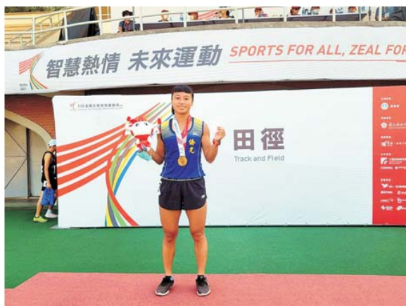
111年全國大專校院運動會田徑一般女5000公尺、10000公尺冠軍

另外在本校一般組籃球隊的表現也不遑多讓，在中華民國大專校院110學年度籃球運動聯賽本校男子籃球代表隊學生在各場比賽中相信自己、團結一心發揮僑光精神，憑藉著這些信念，歷經全臺99所大專院校廝殺，在全國決賽中一路力克台北大學、國立體育大學、台北科大、勤益科大，最後勇奪全國冠軍，取得最後的勝利，也創造僑光校史上的紀錄。